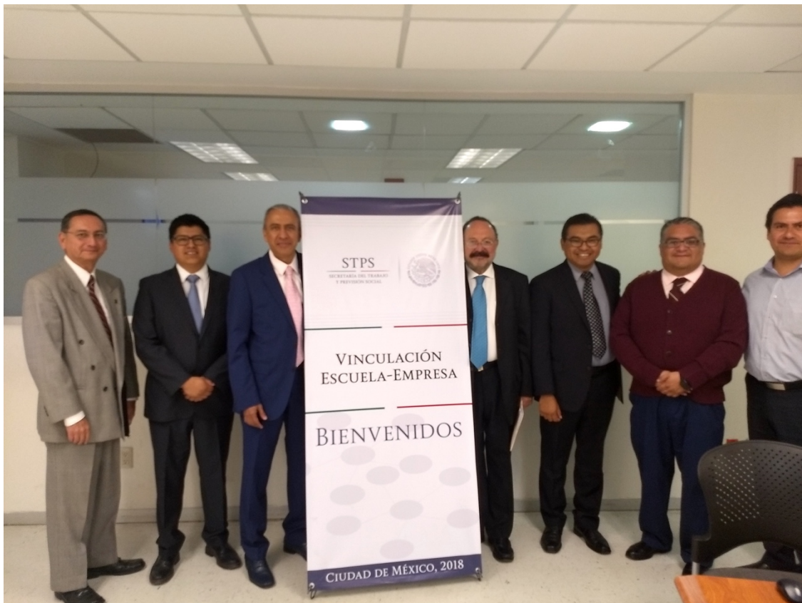
Presidentes, representantes de Consejos Acreditadores pertenecientes a COPAES y Funcionarios de la STPS.

CDMX a 31 de julio de 2018.- Con el objetivo de disertar sobre las características y beneficios para las instituciones educativas y las empresas, así como el impacto en la empleabilidad, de las prácticas de vinculación escuela empresa, con el propósito de dar a conocer los resultados a las instituciones educativas y a las empresas, para que generen los modelos o prácticas de vinculación acorde a sus necesidades particulares, y que éstas incidan de manera positiva en el desarrollo de mayores competencias en sus estudiantes y egresados, el Consejo de Acreditación de la Comunicación y Ciencias Sociales A.C. (CONAC) participó en el seminario “Experiencias de la vinculación escuela-empresa en México” organizado por la Secretaria del Trabajo y Previsión Social (STPS) a través de la Dirección General de Capacitación, Adiestramiento y Productividad Laboral.